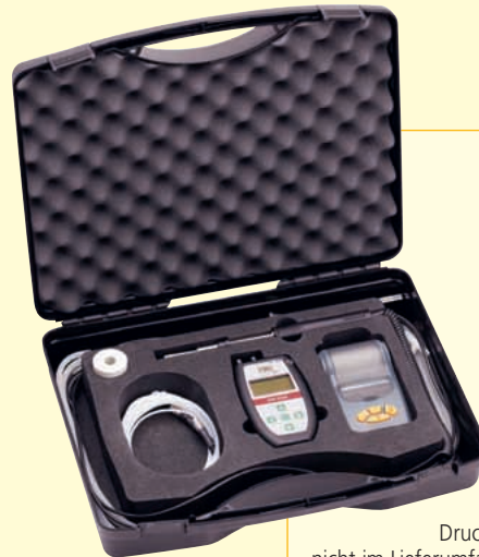
Drucker nicht im Lieferumfang