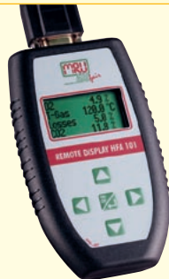
Handfernanzeige mit 10 (20) m Übertragungskabel

Prandtlrohr für Strömungsgeschwindigkeitsmessungen und Volumenstromberechnung